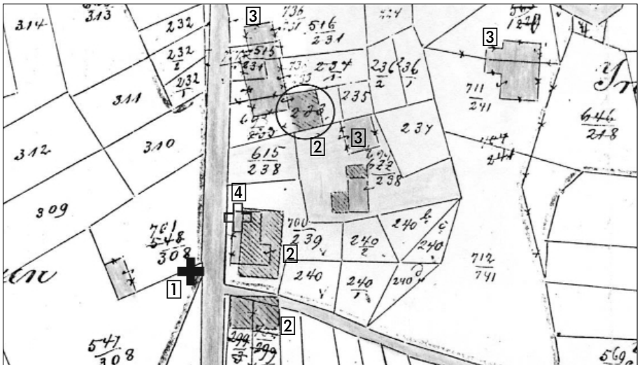
Abb. 3b Aus der Flurkarte Eiseheid Flur 10 von 1873 bis 1908 ① = Standort des alten Kreuzes; ② = neu zwischen 1873 und 1908; ③ = bis 1908 verschwunden; ④ = Standort Kreuz heute. Die Scheune ist neu aber noch ohne jeden Anbau!