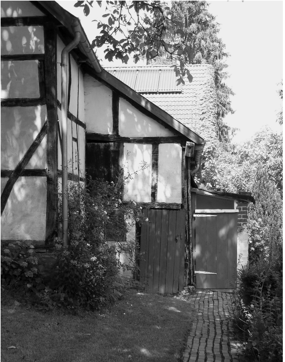
Abb. 2 Anbau der Scheune

entdeckt wurde. Wer war denn so pietätlos, entgegen traditionellen Rücksichten den zweifellos geweihten Balken eines Kreuzes zu profanen Zwecken zu verbauen? Solch Kuriosität wirft die Frage nach der Geschichte des Wegkreuzes auf.