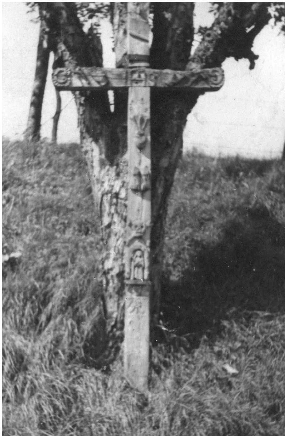
Abb. 1 Wegekreuz am Ower um 1950