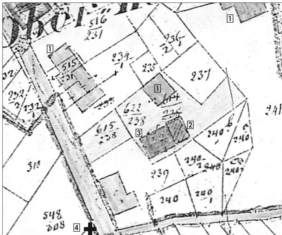
Abb. 3c Aus der Flurkarte Eischeid Flur 10 bis 1863

① = alt; ② = neu zwischen 1827 und 1863; ③ = bis 1863 verschwunden